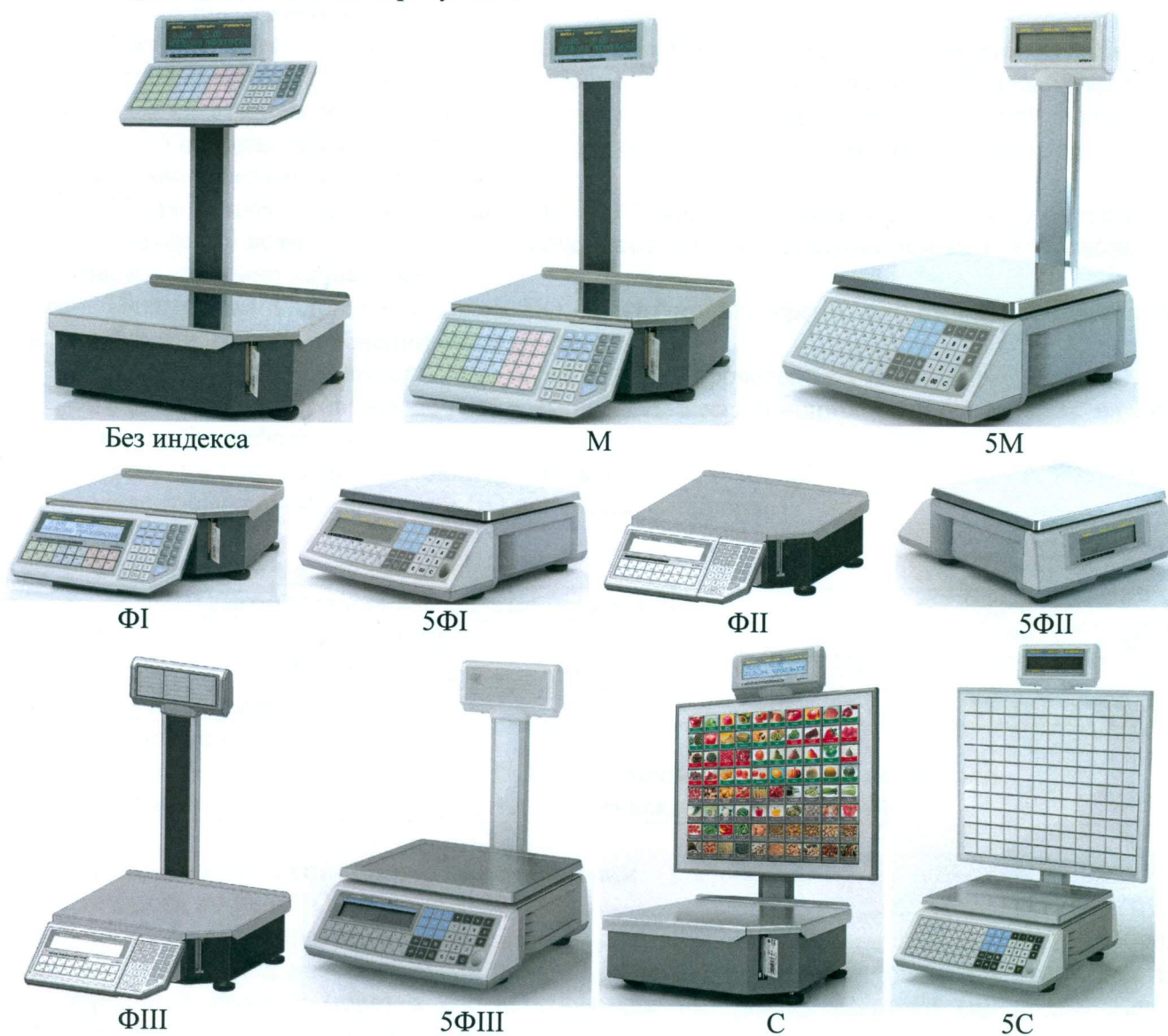
Рисунок 1 - Общий вид весов (индексы: М; 5М, ФI, 5ФI, ФII, 5ФII, ФIII, 5ФIII, С, 5С и без индекса)

Схемы пломбировки от несанкционированного доступа, обозначение места нанесения знака поверки представлены на рисунке 2.