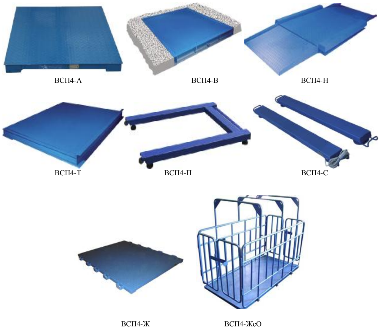
Рисунок 1 — Общий вид ГПУ весов

Общий вид ГПУ весов представлен на рисунке 1.