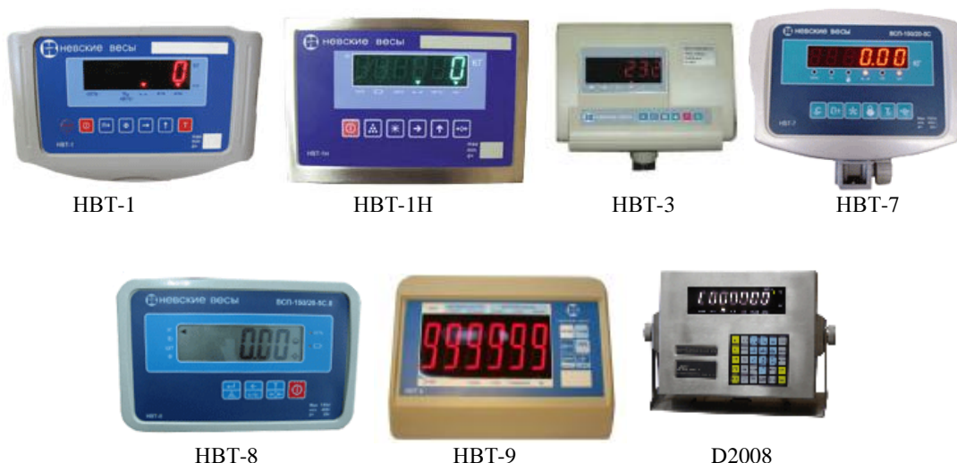
Рисунок 2 — Общий вид весоизмерительных приборов

Общий вид весоизмерительных приборов представлен на рисунке 1.