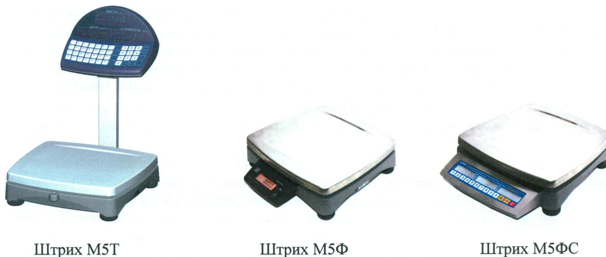
Рисунок 1 – Общий вид весов электронных Штрих М5

Общий вид весов всех конструктивных исполнений показан на рисунке 1.