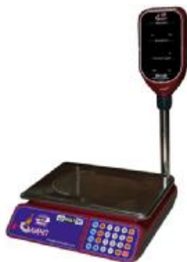
MT 30 МГДА (5/10; 230x330)