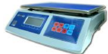
MT 30 ВЖА (5/10; 230x330)