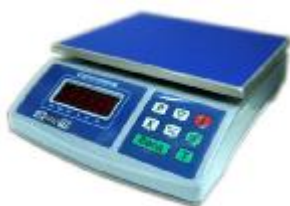
MT 6 ВДА (1/2; 220x270)