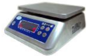
MT 6 В1ДА (2; 225x185, нерж.)