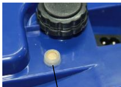
чашевидная оснастка с пломбой

Знак поверки в виде наклейки наносится на лицевую панель весов. Для защиты от несанкционированного доступа к внутренним частям весов и изменений параметров их настройки и юстировки в зависимости от исполнения весов устанавливается либо пломба на крепежный элемент корпуса внутри специальной чашевидной оснастки, либо пломбируется переключатель настройки (рисунок 2).