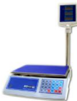
MT 15 МГЖА (2/5; 230x330)