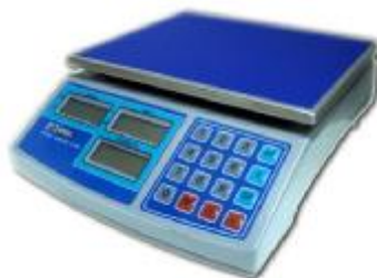
MT 15 МЖА (2/5; 220x270)