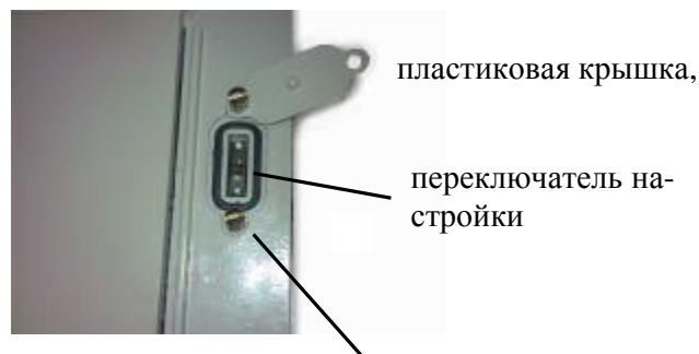
винты с отверстиями для установки пломбы