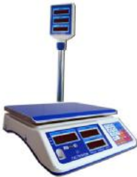
MT 30 МГДА (5/10; 230x320)

Общий вид весов представлен на рисунке 1.