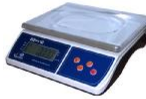
MT 15 В1ЖА (2/5; 230x300)