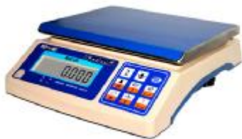
MT 6 ВДА (1/2; 230x290)