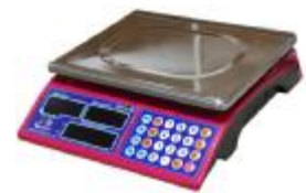
MT 30 МДА (5/10; 230x300)