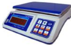
MT 15 В1ДА (2/5; 230x320)