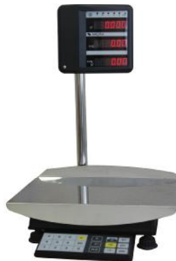
Рисунок 1 - Общий вид весов, выполненных в едином корпусе