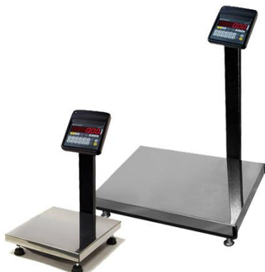
Рисунок 2 - Общий вид весов с весоизмерительной платформой и индикатором.