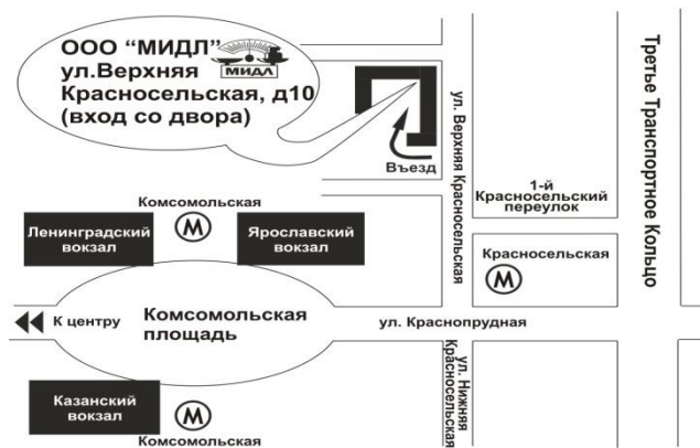
Схема проезда к офису фирмы “МИДЛ”

Филиал ООО «МИДЛ» тел/факс (499) 264-57-65, 264-57-43